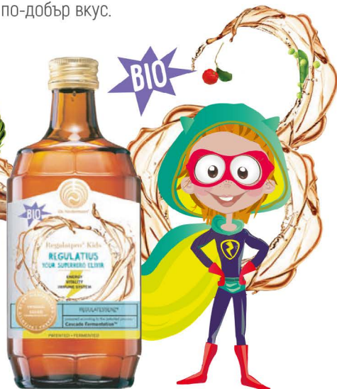
REGULATIUS - ЕЛЕКСИРЪТ НА СУПЕРГЕРОИТЕ!