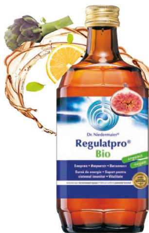
Regulatpro® Bio - окончателно здрави!

• А за децата има Регулатиус – той съдържа концентрираната мощ на Регулат Есенцията (REGULATESENZ®) с добавен витамин С от ацерола за подкрепа на правилното развитие на имунната система и сироп от агаве за по-добър вкус.